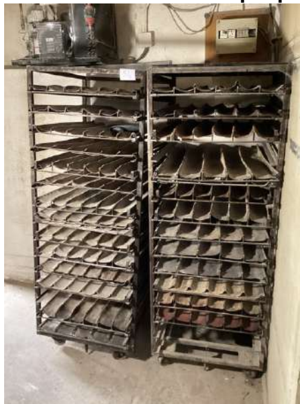
54 - Deux échelles avec plaques à baguettes