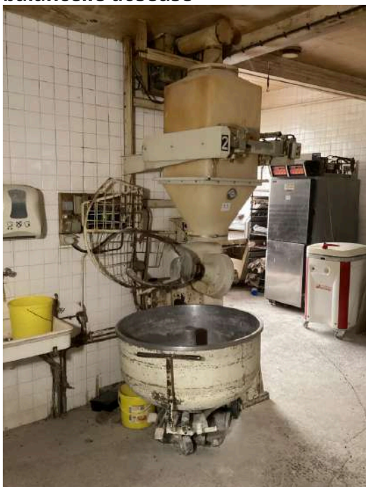
55 - Pétrin 380 litres avec balancelle doseuse