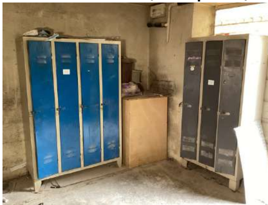
38 - Deux vestiaires (4 et 3 portes)