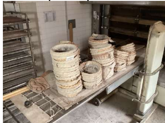
59 - Lot de pâtons + pelle à four + balai