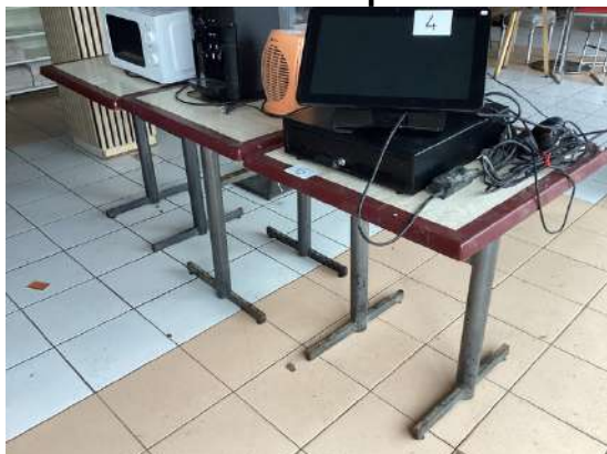
6 - Trois tables carrées plateaux résine