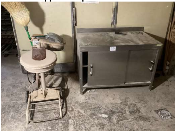
53 - Meuble inox deux portes à crédence 120x70 + support sac poubelle