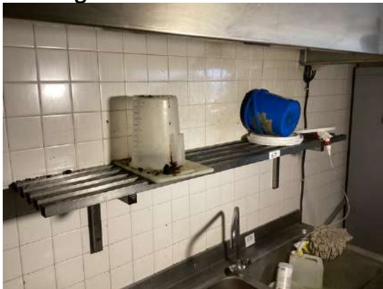
69 - Étagère inox à barreaux 30x170