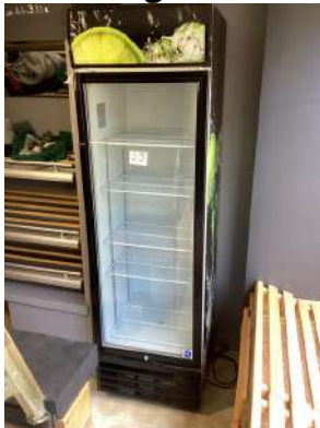
29 - Réfrigérateur vitré