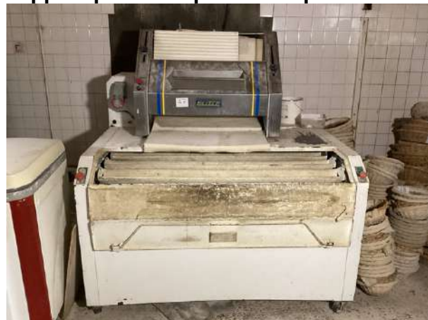
47 - Façonneuse ELITE avec balancelle support pâtons capacité 400 pâtons