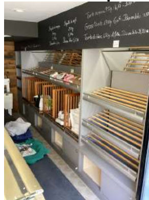
30 - Meuble à pain + boitage