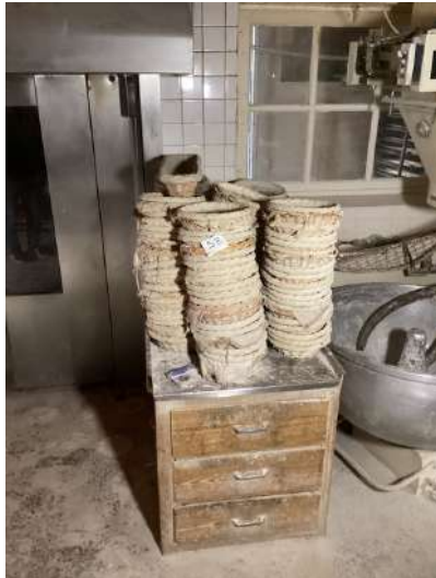
58 - Lot de pâtons + meuble à tiroir