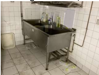
20 - Plonge deux bacs (170x80)