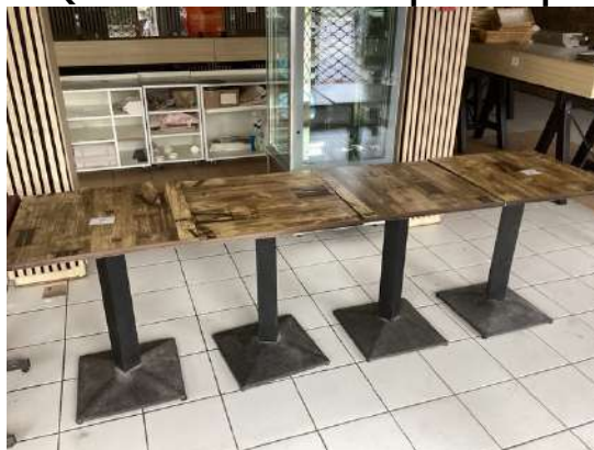
7 - Quatre tables carrées plateau pvc imitation bois