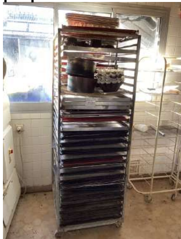
75 - Échelles avec grilles + plaques + moules