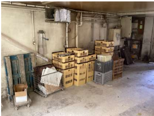
37 - Lot de caisse à pain + plaques + chariots