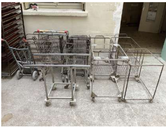
39 - Lot de chariots et un diable