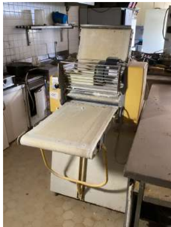
66 - Laminoir SEEWER RONDO