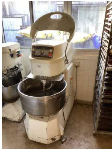
76 - Pétrin