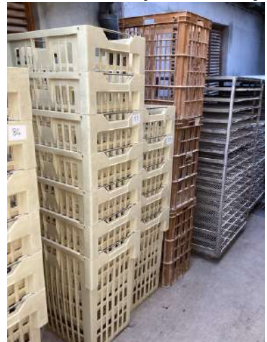
85 - Lot de 15 panières à pain