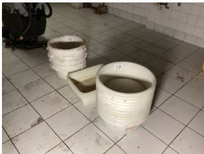
19 - Lot 29 bacs GILAC