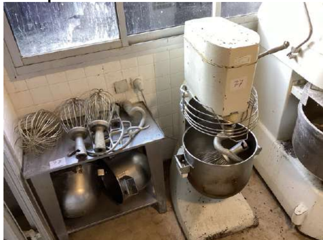
77 - Pétrin DITO SAMBA B40 avec 3 bols + 4 fouets + 2 vrilles + 2 feuilles + desserte inox deux plateaux