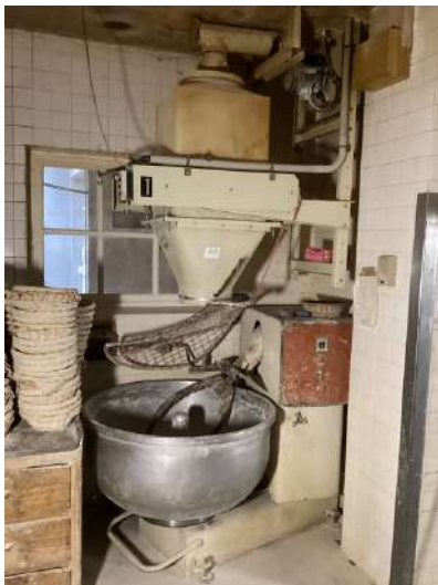
57 - Pétrin 380 litres avec balancelle doseuse