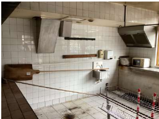
13 - Pelle à four + balai de four + lave-main inox + microonde