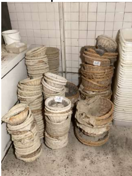
48 - Lot de pâtons