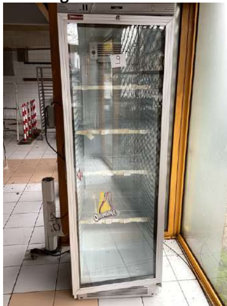
9 - Réfrigérateur vitré Diamond