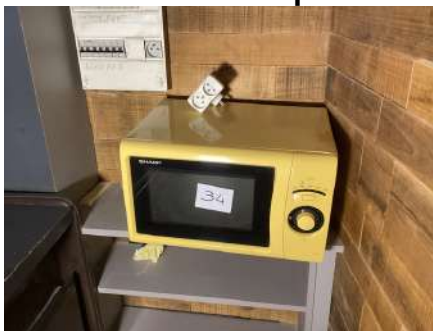
34 - Microonde Sharp