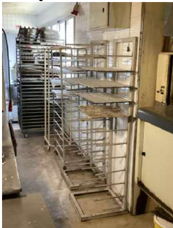
65 - Quatre échelles métalliques