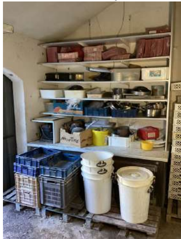
79 - Lot divers (local chambre froide)