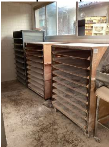
63 - Cinq chariots parisiens