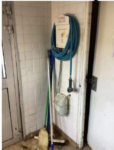
78 - Centrale de lavage