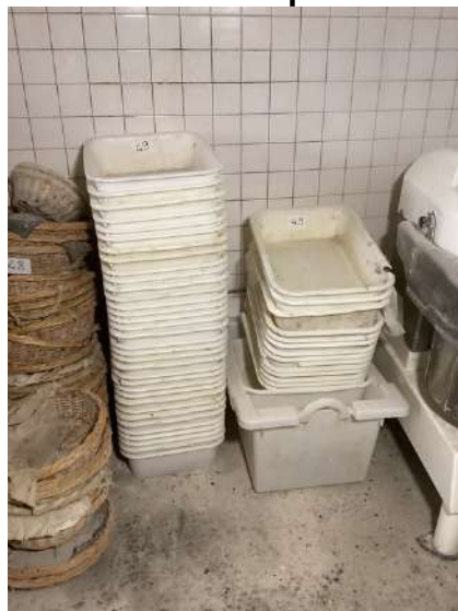
49 - Lot de bacs à pâte