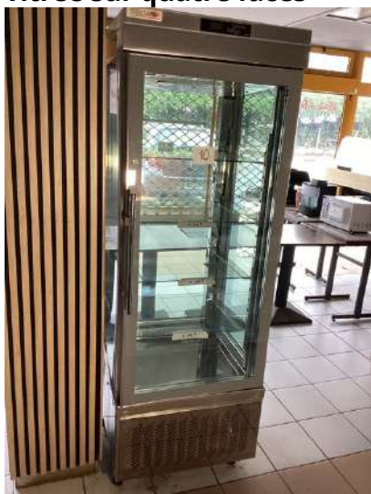
10 - Vitrine réfrigérée SEDA vitrée sur quatre faces