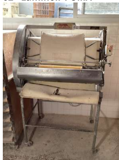
62 - Laminoir PUMA