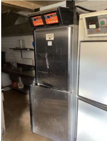
71 - Chambre de pousse PANEM deux portes