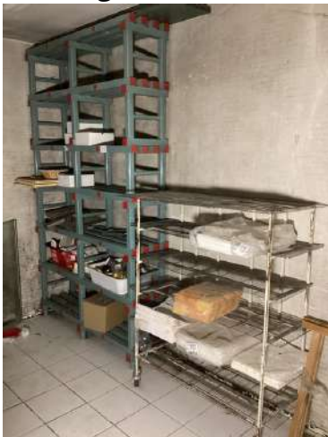
23 - Étagères et contenu