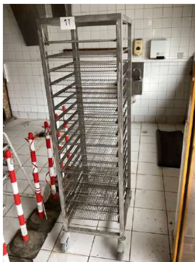
11 - Échelle inox avec 20 grilles