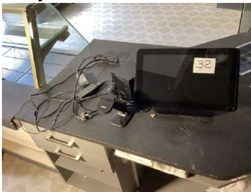
32 - Système de caisse OXHOO avec douchette, imprimante