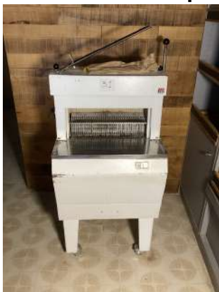
31 - Trancheuse à pain JAC