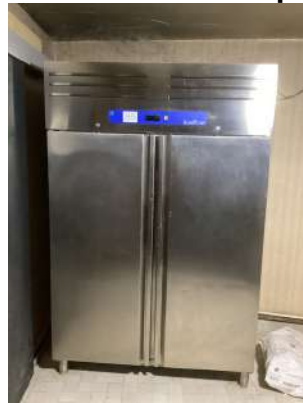
35 - Chambre froides positive EUROCHEF à deux portes