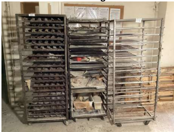
52 - Trois échelles avec grilles