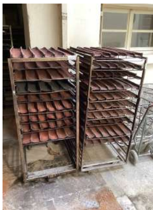
40 - Deux échelles avec plaques à baguettes