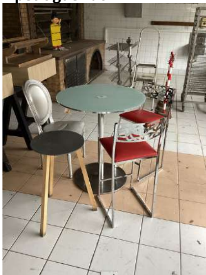
8 - Mange-debout + trois chaises + petit guéridon