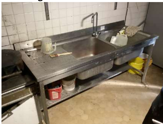
68 - Plonge inox deux bacs 70x190