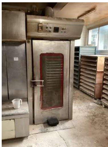
61 - Four TIBILETTI