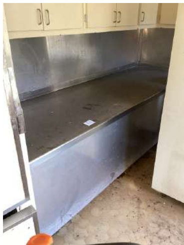
73 - Table avec plateau inox 90x280