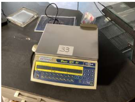
33 - Balance DINA