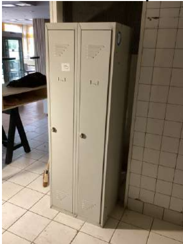
15 - Vestiaires deux portes