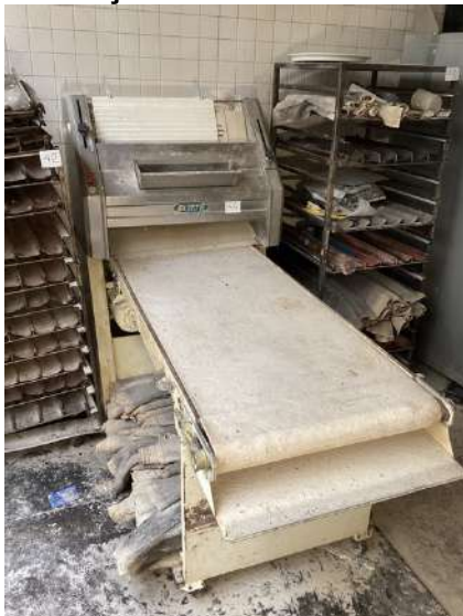
44 - Façonneuse ELITE