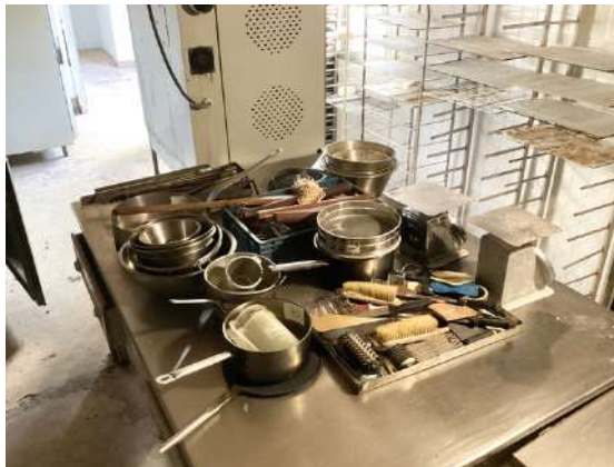
70 - Lot de vaisselle + deux balances