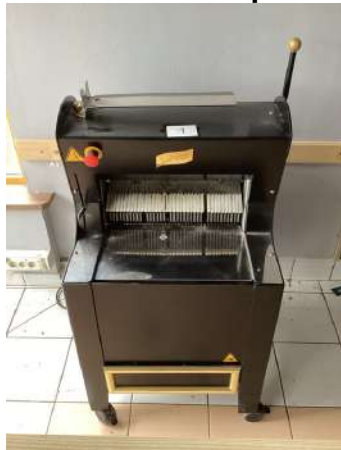
1 - Trancheuse à pain SOFINOR 380V