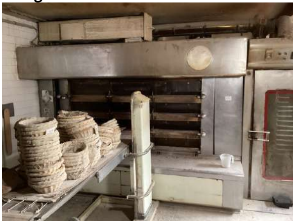
60 - Four à pain avec tapis de chargement