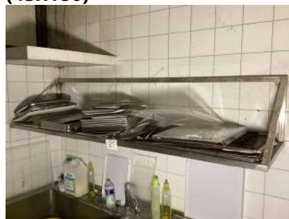
21 - Étagère inox et son contenu (45x180)