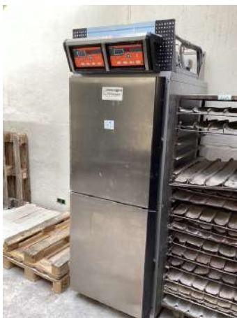
41 - Chambre à pousse deux portes PANEM