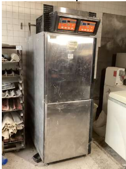
45 - Chambre de pousse PANEM à deux portes