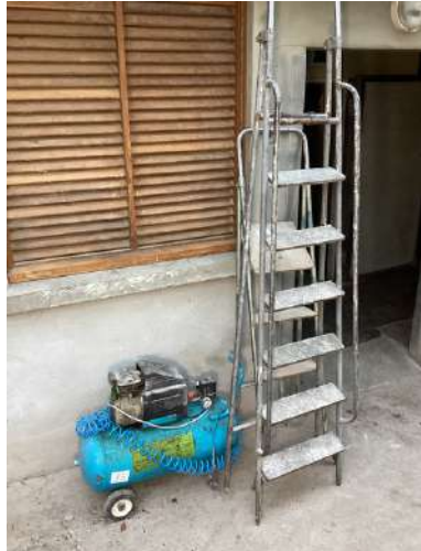
83 - Compresseur LACME + deux escabeau