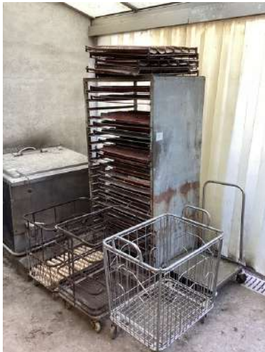
81 - Une échelle + plaques + 4 chariots