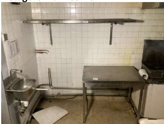
67 - Table inox 100x70 + étagère inox 180x48