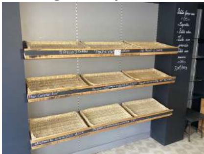
25 - Étagères et panières