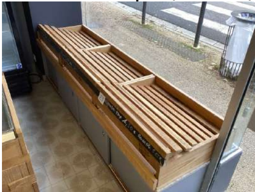
28 - Trois casiers à pain ( en vitrine)