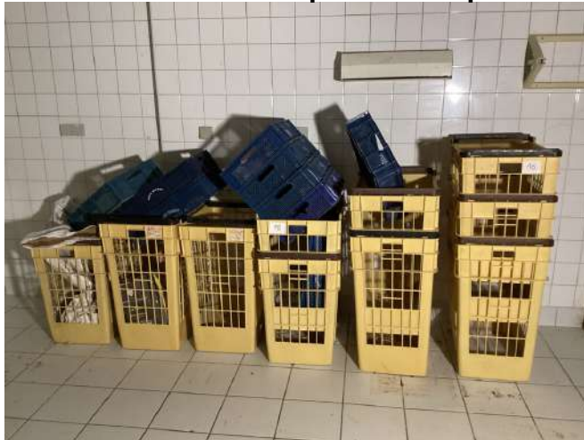
16 - Lot de six caisses à pain et huit panières