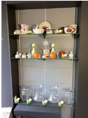
24 - Lots bibelots