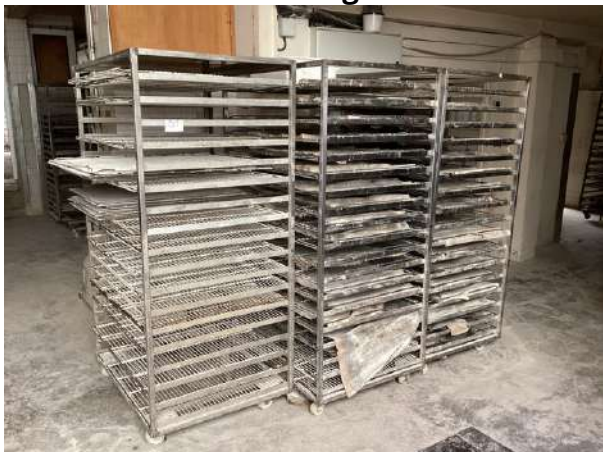
51 - Trois échelles avec grilles