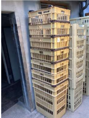
84 - Lot de 13 panières à pain