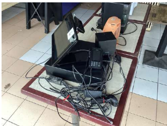
4 - Système de caisse OXHOO + imprimante + douchette