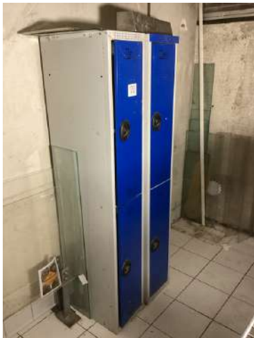
22 - Deux vestiaires 4 portes bleus