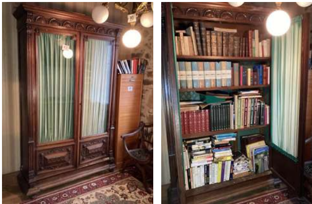
69 - Bibliothèque en noyer + livres + classeur à rideau