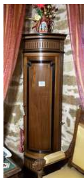
39 - Meuble encoignure en bois verni de style directoire