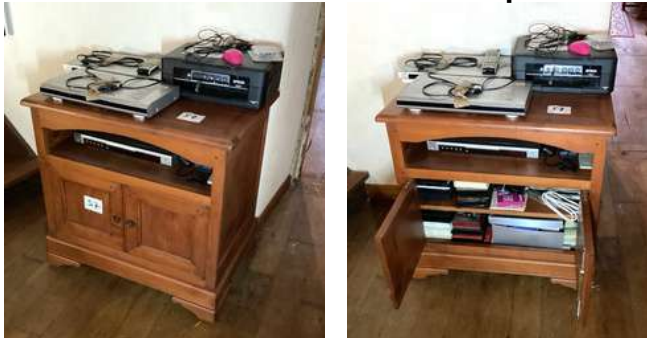
57 - Meuble TV merisier + hi-fi + imprimante