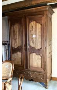
77 - Grande armoire en noyer deux portes un tiroir en plinthe