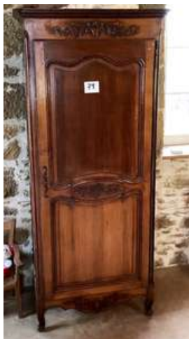
79 - Bonnetière une porte merisier et son contenu