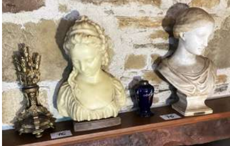
76 - Deux bustes Jeune fille en cire et en plâtre + bougeoir pied de lampe