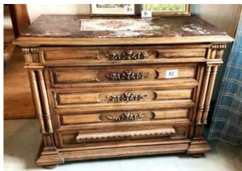
72 - Commode à hauteur d'appui 5 tiroirs dessus marbre et son contenu