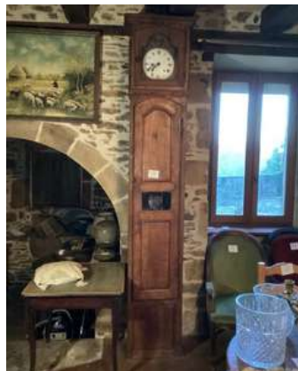
13 - Horloge de parquet droite en chêne cadran accidenté