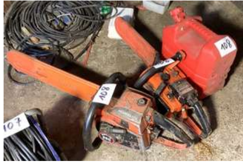
108 - Deux tronçonneuses + un jerrican