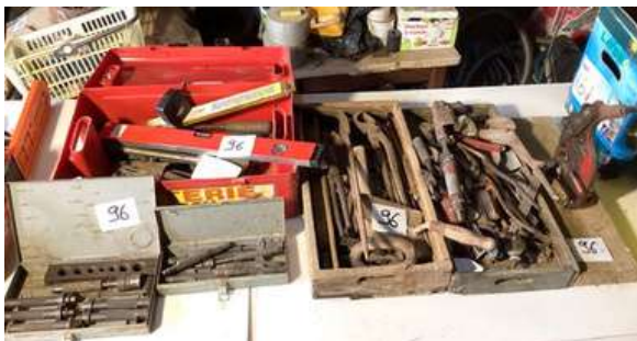
96 - Outillage de couvreur zingueur