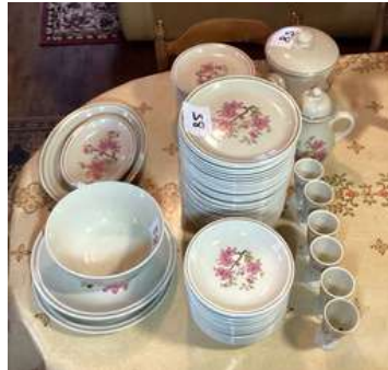
58 - Service de vaisselle GIEN