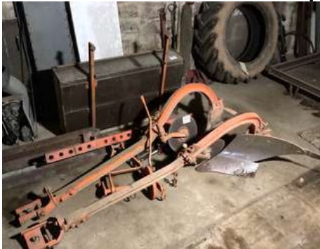
121 - Charrue deux bras et baquet