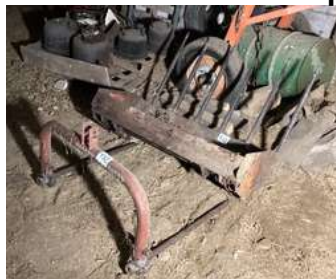
132 - Godet à dents et pic balle