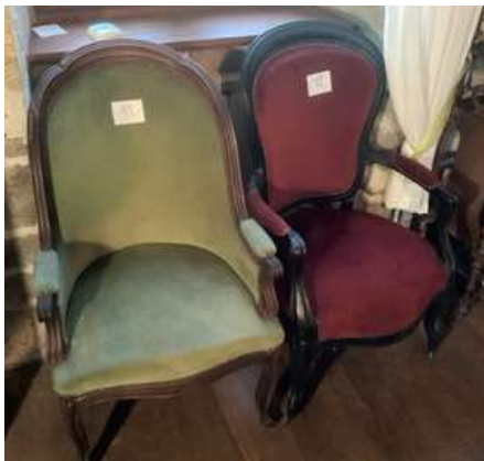
12 - Deux fauteuils style Louis Philippe Velours