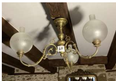
47 - Lustre laiton trois globes