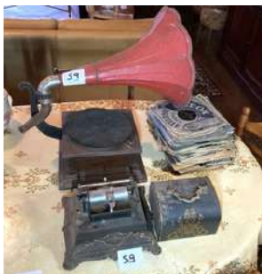
59 - Gramophone à pavillon et gramophone à rouleau Ménestrel + disques 78 tours