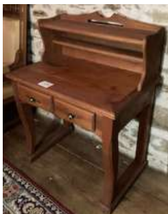
37 - Tablette merisier avec deux tiroirs