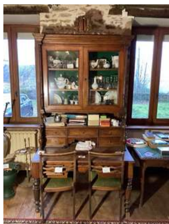
42 - Bureau style Louis Philippe en noyer verni, surmonté d'un corps haut vitré et deux chaises