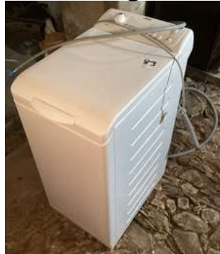
89 - Lave-linge FAURE