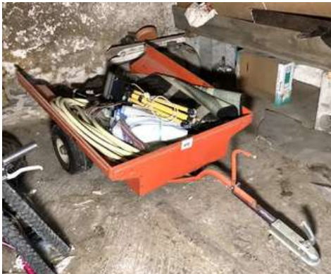
111 - Remorque basse et son contenu