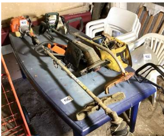
100 - Deux débroussailleuses + un taille bordure+ sacoche de pièces détachées