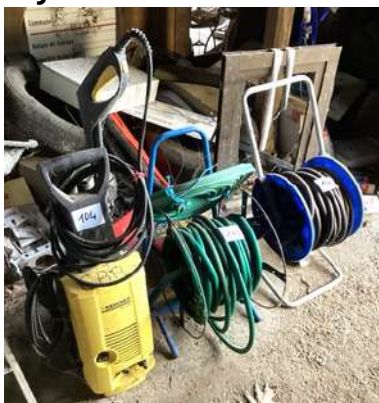
104 - Nettoyeur haute pression KARCHER + tuyaux sur enrouleur