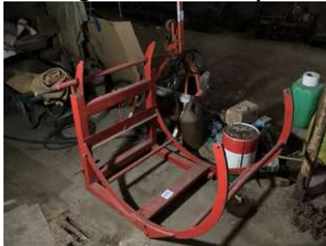
122 - Fagoteuse sur trois points