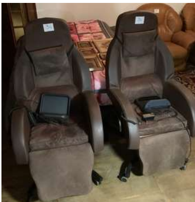
34 - Deux fauteuils électriques