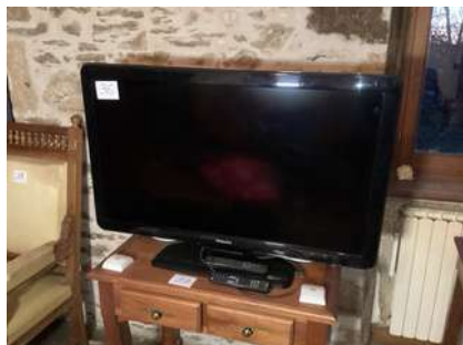
36 - Télévision Philips