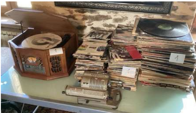
1 - Lot de disques 45 T et 33 T avec tourne-disque + ancienne machine à calculer