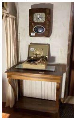
48 - Console de style Louis Philippe + plateau verre + tourne disque + carillon