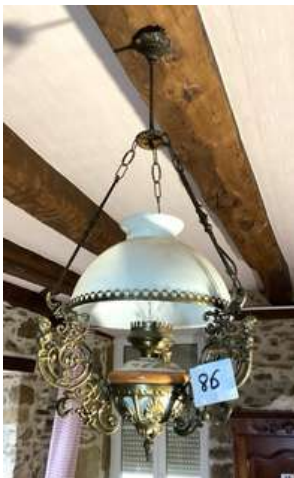
86 - Lustre avec opaline