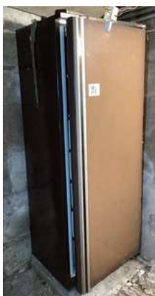
91 - Congélateur vertical Brandt