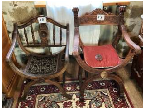
68 - Deux fauteuils DAGOBERT