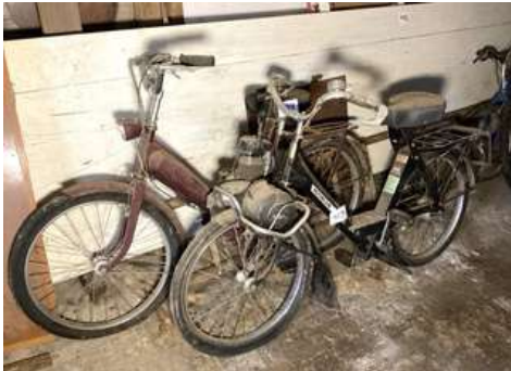
109 - Deux vélos moteur Motobécane (un Solex S3800 + un second sans moteur)