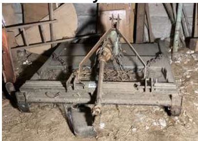
129 - Girobroyeur à lames