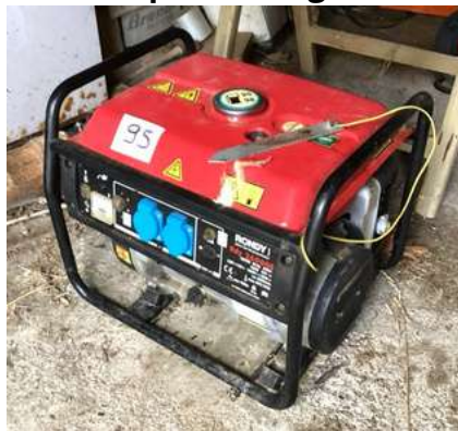
95 - Groupe électrogène RONDY 2600 GE