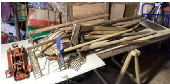
98 - Lot d'outillage + cric roulant