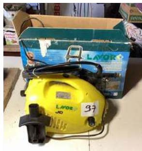
97 - Nettoyeur haute pression LAVOR