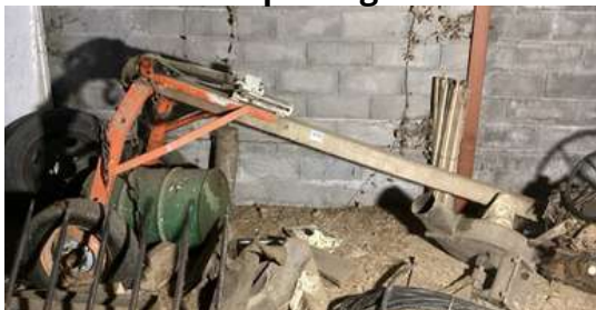
131 - Un fardier porte grume