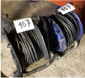
107 - Deux enrouleurs électriques