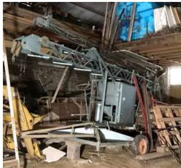
137 - Grue de couvreur