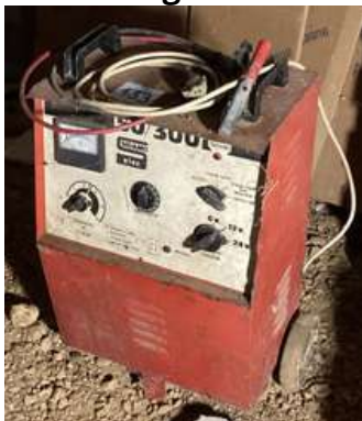
133 - Chargeur démarreur