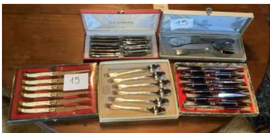
15 - Cinq écrins de couverts