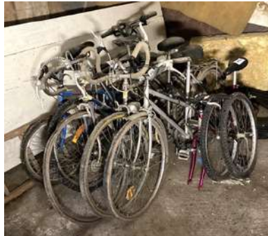
110 - Sept vélos