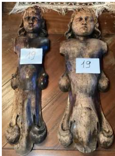
19 - Paire d'angelots en bois à dos plat