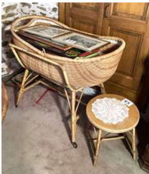
83 - Berceau en rotin + table rotin