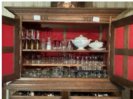
21 - Vaisselle du haut du buffet