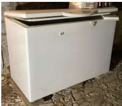
88 - Congélateur blanc LIEBHERR (cave)