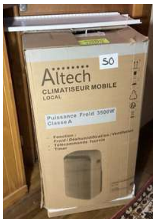
50 - Climatisation mobile