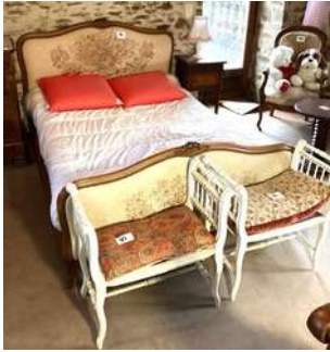
81 - Lit capitonné + chevet + lampe + deux petites banquettes