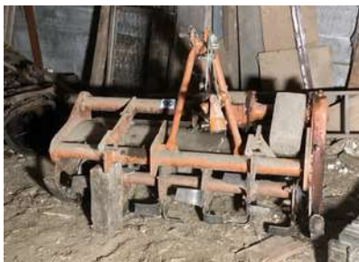
130 - Fraise rotative HOWARD ROTAVATORE