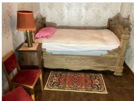
63 - Mobilier de la chambre : lit de coin chevet lampe obus 2 chaises banc