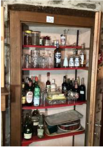
30 - Contenu du meuble bar