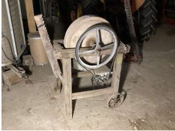
119 - Meule électrique