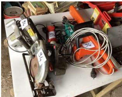
94 - Deux scies circulaires+ une disqueuse 125 +perceuse + tronçonneuse électrique