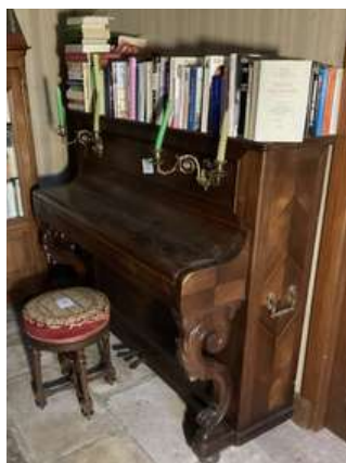
26 - Piano droit Erard ébénisterie palissandre et tabouret de piano