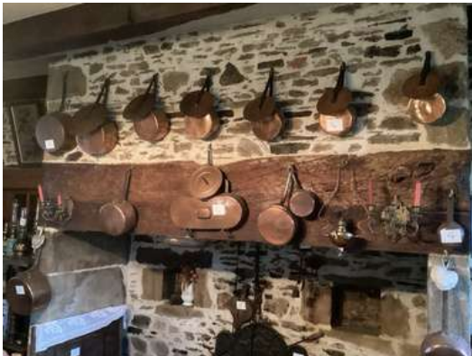
4 - Ensemble de cuivres 12 casseroles un lèche fritte 6 couvercles et un chaudron