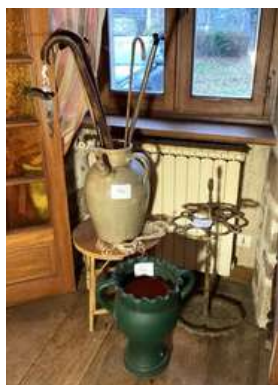
44 - Lot pot terre cuite + cruche vernissée + lot de cannes + porte-parapluies en fonte