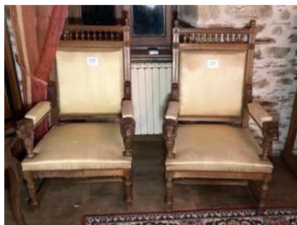
38 - Paire de fauteuil style Louis XIII à tête de lion