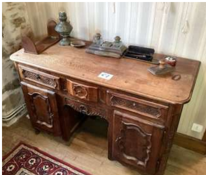
67 - Bureau