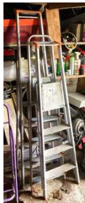
103 - Trois escabeaux