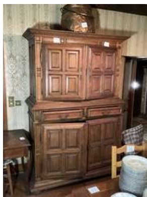
23 - Buffet de style Louis XIII à deux corps ouvrant sur quatre portes et deux tiroirs