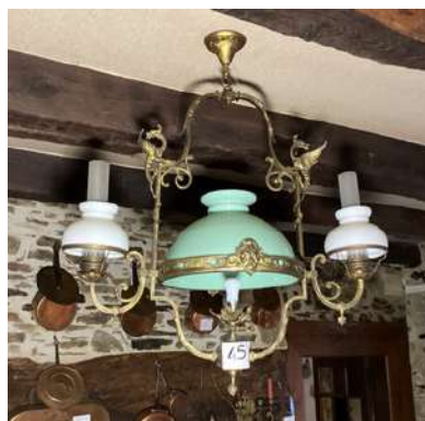
45 - Lustre opaline (deux globes blancs et un globe central vert)