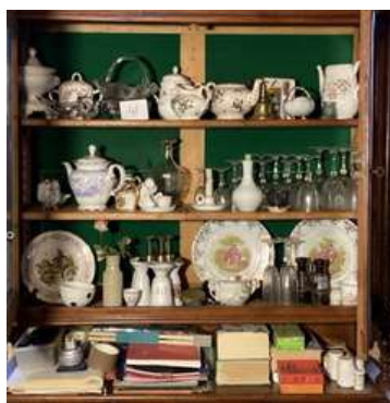
41 - Contenu du haut du vitré du bureau