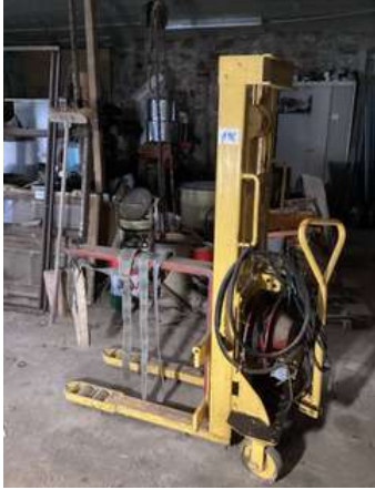
118 - Chariot élévateur en 380 v