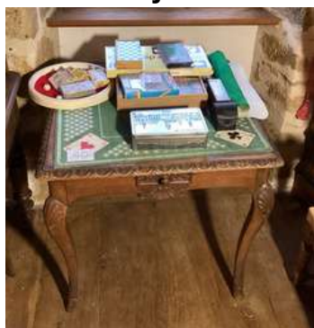
40 - Table de jeux en chêne à plateau carré avec lot de jeux