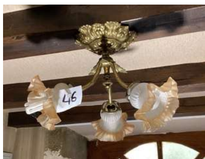
46 - Lustre laiton trois tulipes