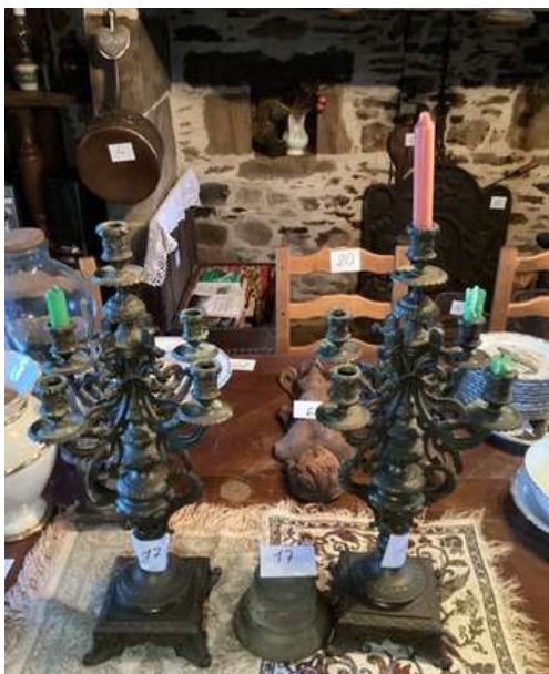
17 - Paire de candélabres bronze et une cloche