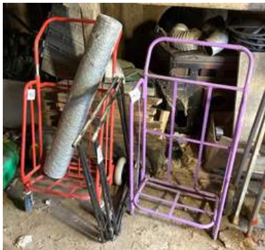
102 - Deux chariots type diable + rouleau de grillage + deux tréteaux