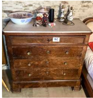
82 - Commode à pans coupés en noyer dessus marbre blanc quatre tiroirs + contenu + déco dessus