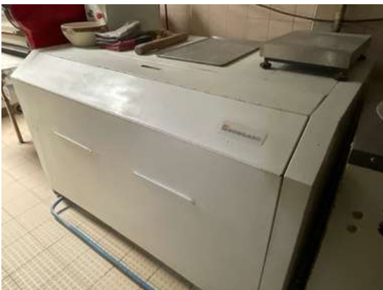
Lot 18 - 1 Repose pâtons BONGARD