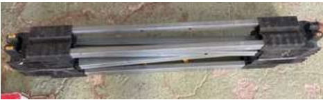
Lot 52 - 1 Tréteau