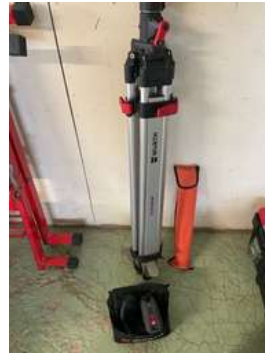
Lot 51 - 1 Laser WURTH