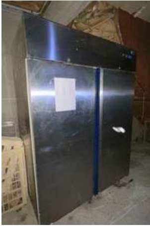
Lot 28 - 1 Congélateur négatif 2 portes inox ISA