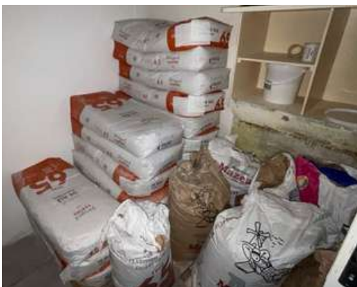
Lot 26 - 19 Stock farine Sacs entier type 65