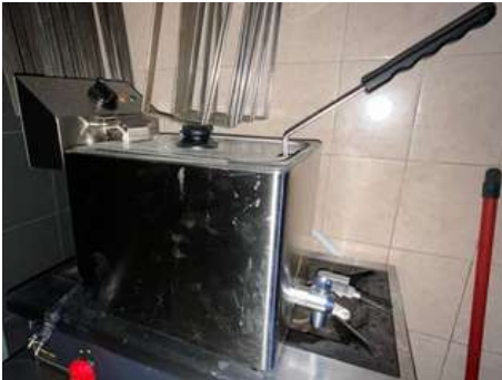
Lot 13 - 1 Friteuse