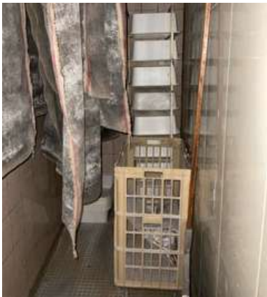
Lot 24 - 1 Echelle à bac et bacs