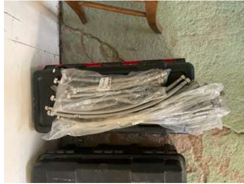
Lot 49 - Flexibles de branchement evier