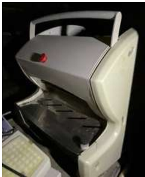
Lot 5 - 1 Trancheuse