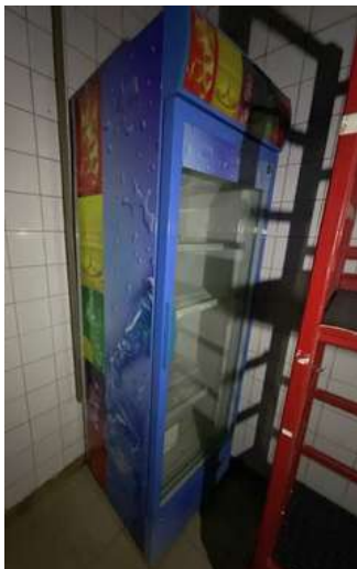
Lot 7 - 1 Vitrine boissons