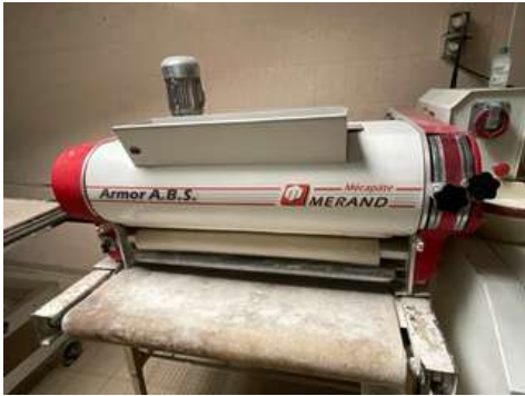
Lot 20 - 1 Façonneuse MERAND