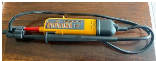
Lot 46 - 1 Testeur tension électrique VAT FLUKE T90