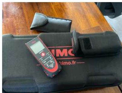
Lot 42 - 1 Télémètre LEICA