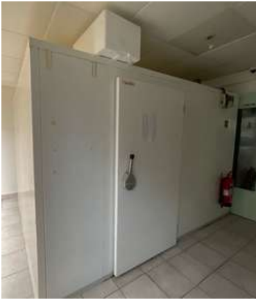
Lot 10 - 1 Chambre froide CASAFLOR