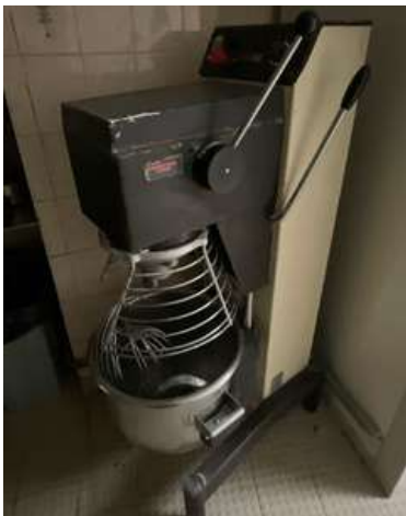
Lot 30 - 1 Batteur DITO SAMA 20 l