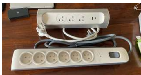
Lot 45 - 2 Blocs multiprises