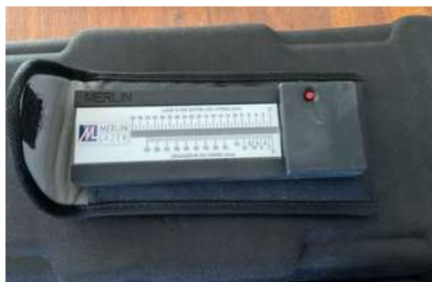
Lot 41 - 1 Vitro mètre