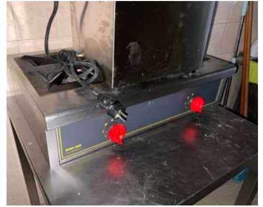
Lot 12 - 1 Plaque deux feux gaz EUROBAR