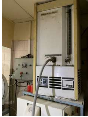
Lot 16 - 1 Refroidisseur eau