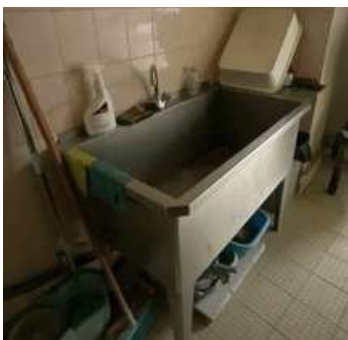
Lot 32 - 1 Plonge