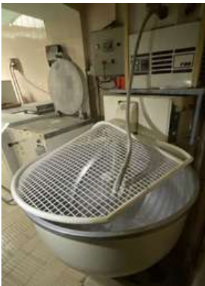
Lot 15 - 1 Pétrin PHEBUS 2000 120I