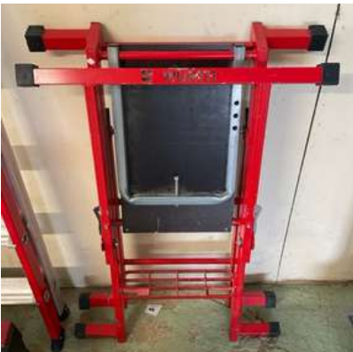
Lot 54 - 1 Plate-forme WURTH