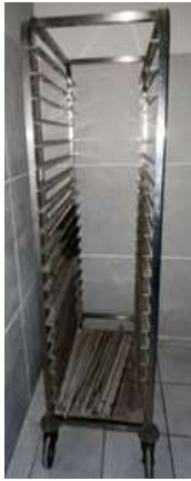
Lot 11 - 1 Echelle inox