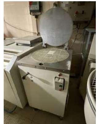
Lot 17 - 1 Diviseuse