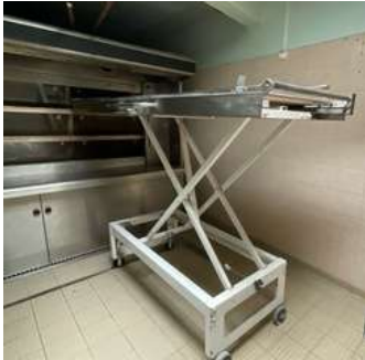
Lot 22 - 1 Chargeur