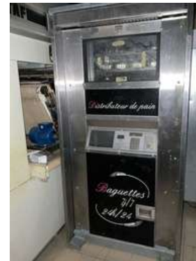
Lot 4 - 4 Distributeurs baguettes