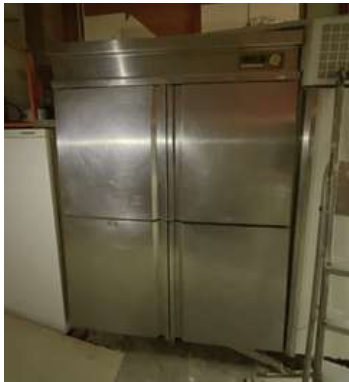
Lot 1 - 1 Réfrigérateur positif ALPENINOX