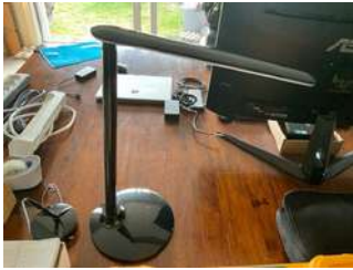
Lot 38 - 1 lampe