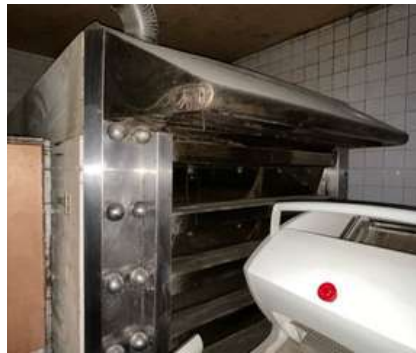
Lot 6 - 1 Four à pain électrique