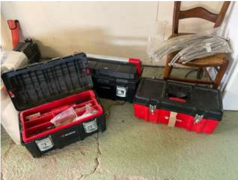
Lot 50 - 3 Boîtes à outils et petits matériels WURTH