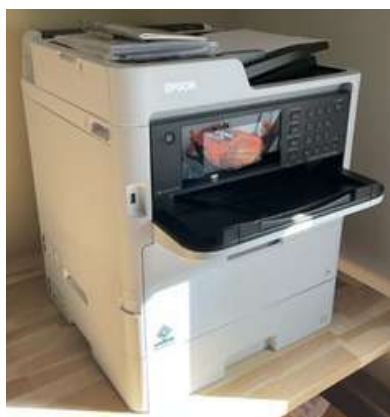
Lot 43 - 1 Imprimante EPSON WF C579r, Jet d'encre pro 2023