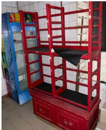
Lot 8 - Étagère en bois pour pains