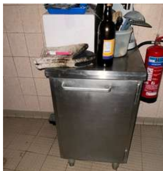
Lot 33 - 1 Meuble inox