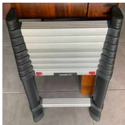
Lot 44 - 1 Échelle télescopique TELESTEP 3 m