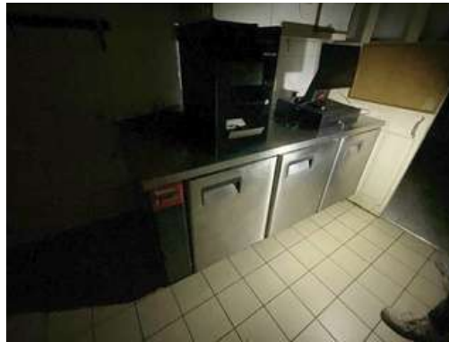
Lot 2 - Tour réfrigéré ISOTECH moteur déporté 3 portes