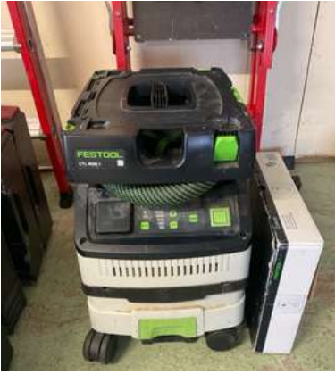
Lot 48 - 1 Aspirateur FESTOOL CTL MINI 2023 T