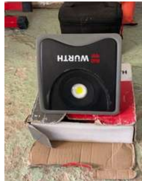
Lot 53 - 1 Lampe LED WURTH