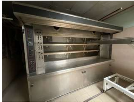
Lot 21 - 1 Four à fuel